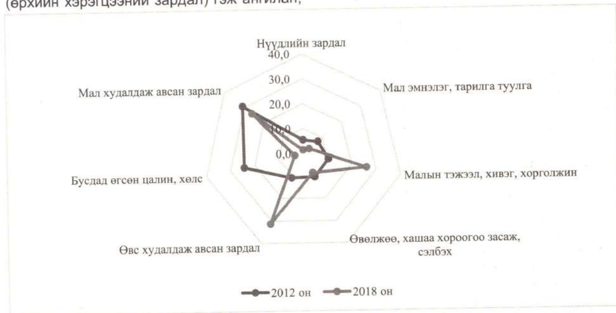
График 3. Өрхийн 1 жилийн МАА-н зардал

хувиар гаргаж 2012 онд явуулсан судалгааны дүнтэй харьцуулж, өөрчлөлтийг харуулав.