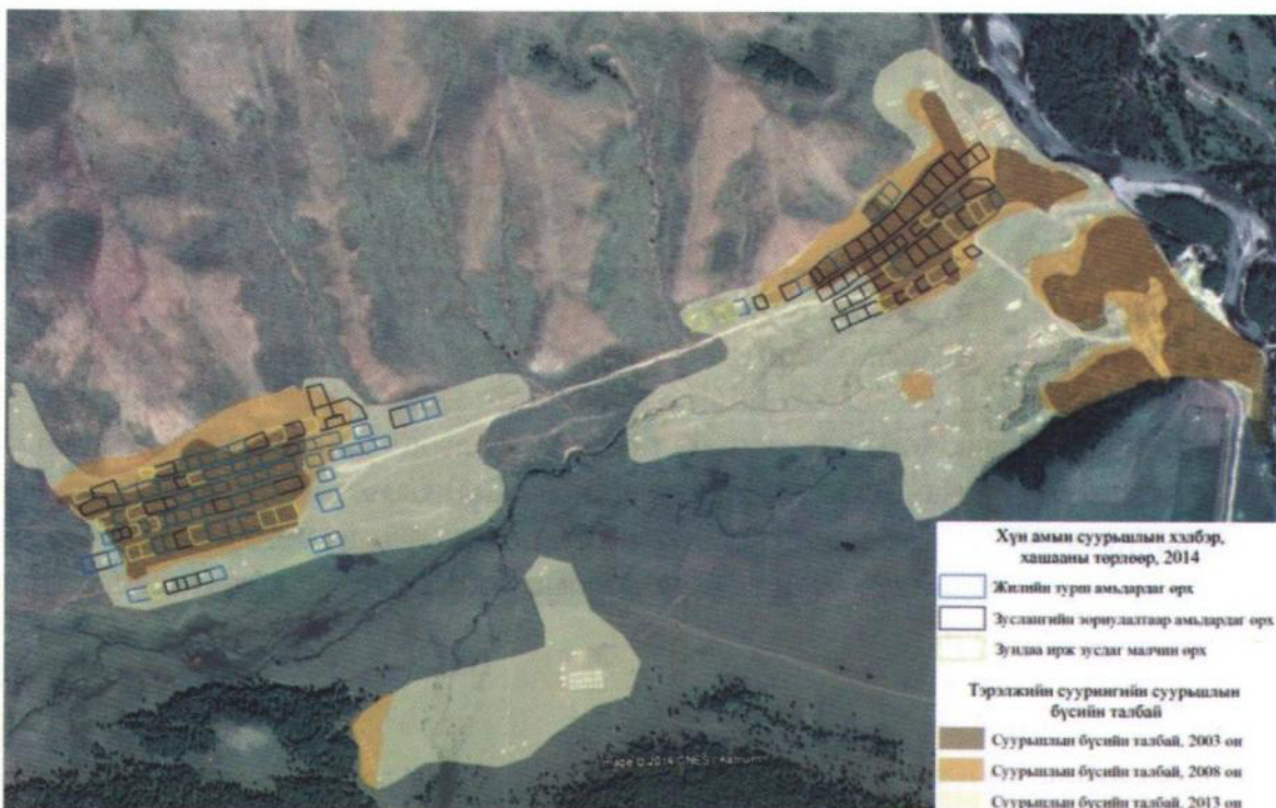
Зураг 17. 3 Тэрэлж суурингийн хүн амын суурьшлын хэлбэр

Тэрэлж голын сав газар 24.5 мянган толгой малтай (2013 он)-гаас 32.8 хувь нь Налайх дүүргийн 6-р хороо буюу Тэрэлж суурин болон суурины орчимд байршина. Нийт мал сүргийн 35 хувийг хонь, 28.7 хувийг ямаа, 26.1 хувийг үхэр,