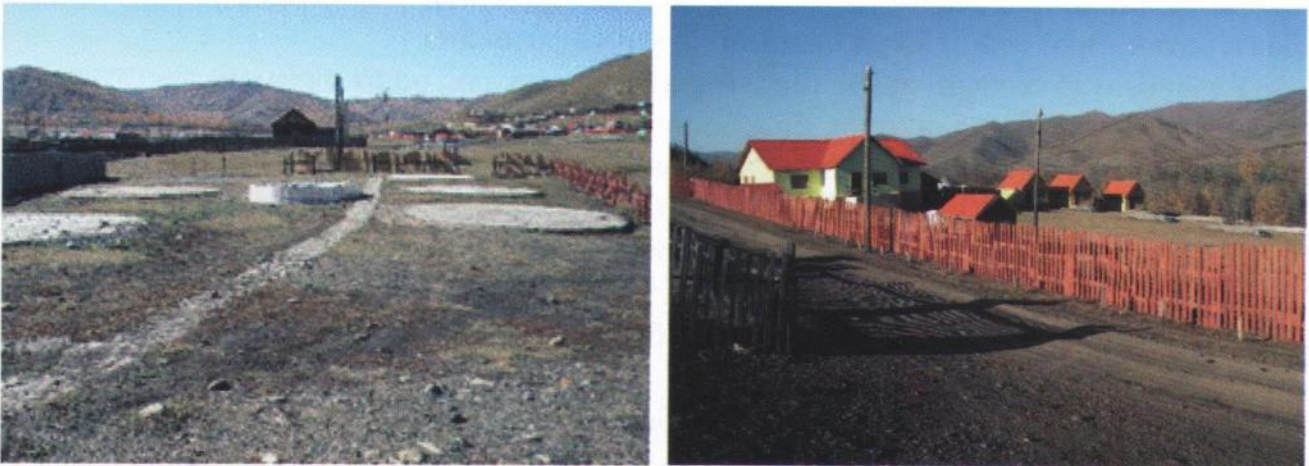
Зураг 17. 2 10 сар хүргээд үйл ажиллагаагаа зогсоосон гэр буудлын гэрийн буурь

Нийт ажиллагчдын 2.6 хувь нь төрийн захиргаа, 3.9 хувь нь төрийн үйлчилгээ (боловсрол, эрүүл мэнд), 40.5 хувь нь үйлчилгээ, жижиг дунд үйлдвэрлэлийн салбарт ажилладаг. Үйлчилгээний салбарт хөдөлмөр эрхэлж буй ажиллагчдын 52.4 хувь нь жуулчны бааз, хувиараа гэр буудал, морь унуулах үйлчилгээ зэрэг жуулчидтай шууд харьцдаг үйлчилгээ, 47.6 хувь нь худалдаа үйлчилгээ, зоогийн газар зэрэг шууд бус харьцдаг салбарыг ажиллуулж байна.