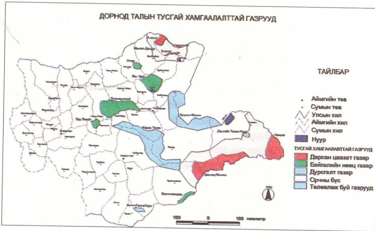
1 дүгээр зураг. Зүүн бүсийн ТХГН

Монгол орны дорнод хэсэгт Хэнтийн уулт тайгын муж, Дагуурын уулын хээрийн муж, Дорнод Монголын хээрийн муж, Дарьганга-Эрдэнэцагааны уулын хээрийн муж, Хянганы баруун хэсгийн ойт хээрийн муж гэсэн байгалийн бие даасан 5 муж ялгарах бөгөөд дотор нь дэд мужууд ялгарч байна (1 дүгээр хүснэгт).