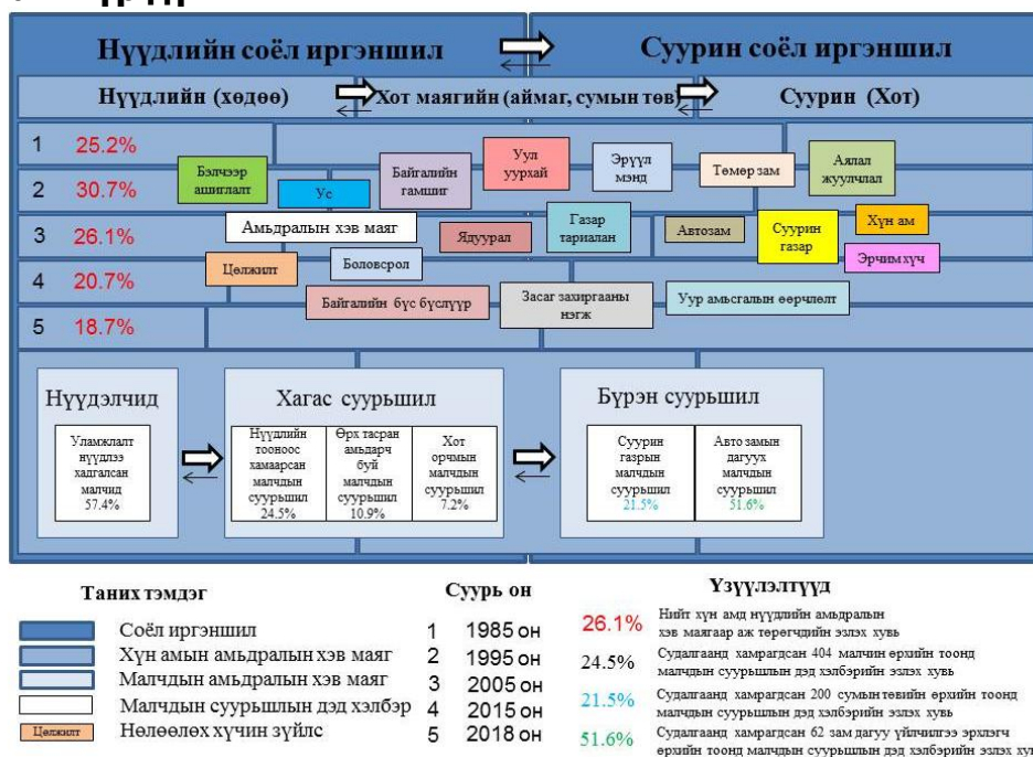
Бүдүүвч 1. Малчдын амьдралын хэв маяг

Хээрийн судалгаанд хамрагдсан малчин өрхийн 57.4 хувь нь нүүдэлч малчид байх бөгөөд эдгээр өрх нь жилд 3-аас олон удаа нүүдэллэн мал аж ахуйгаа эрхэлж байв. Байгалийн бүс бүслүүрийн онцлогоос хамаарч нүүдлийн тоо, зай хэлбэлзэлтэй ба ойт хээрийн бүсийн малчид жилд 3.7 удаа,