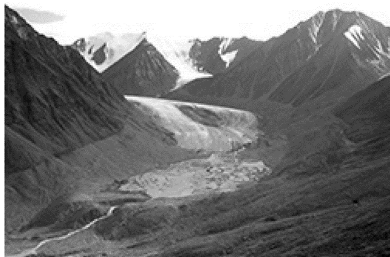
Okpilak Glacier, Alaska, United States. August 2004