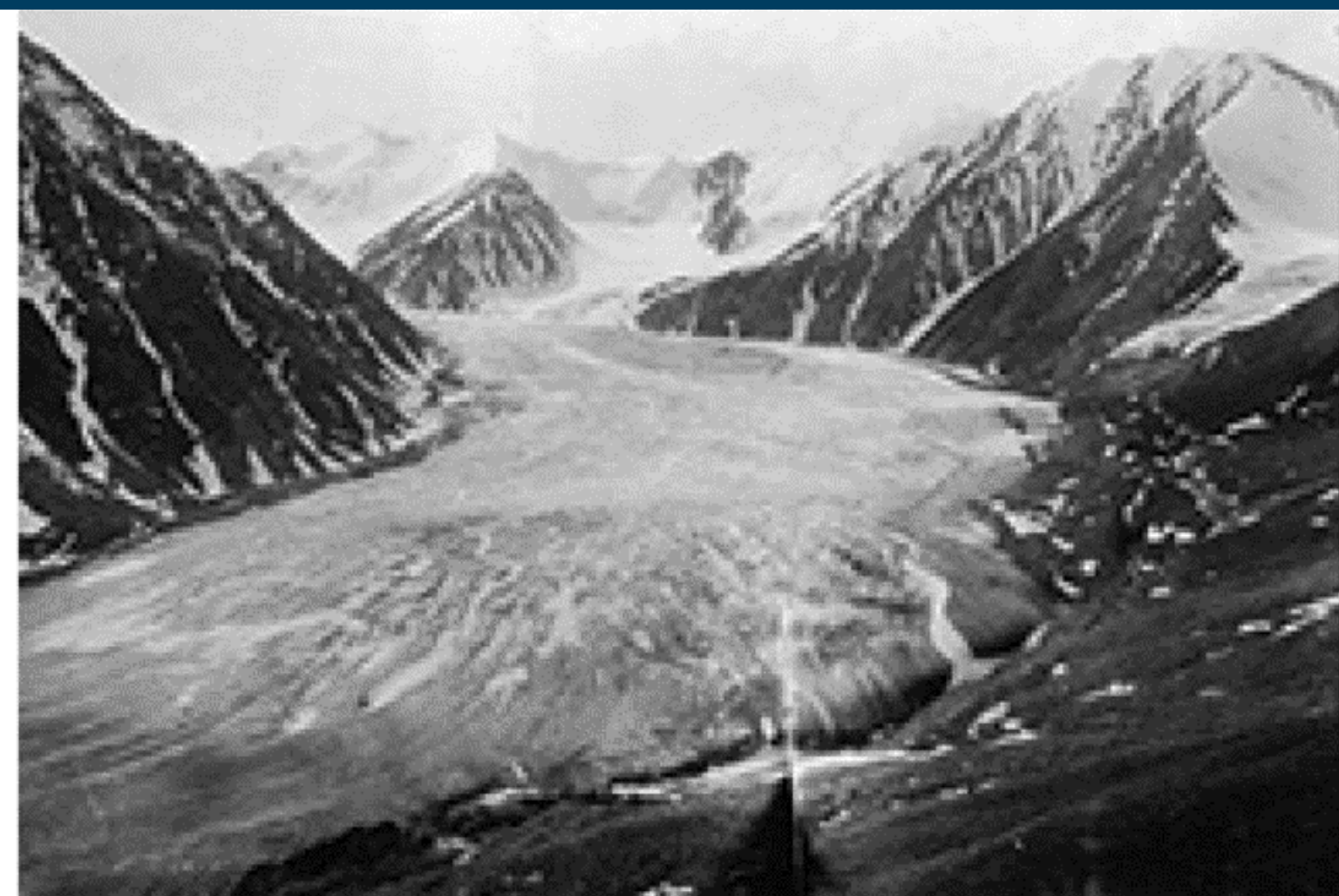
Okpilak Glacier, Alaska, United States. June 1907, by Ernest Leffingwell. From the Glacier Photograph Collection. Boulder, Colorado, USA: National Snow and Ice Data Center.

1980–2015 оны хооронд Дээхийн температурын өсөлт 0.7 градусаар нэмэгдсэн байна