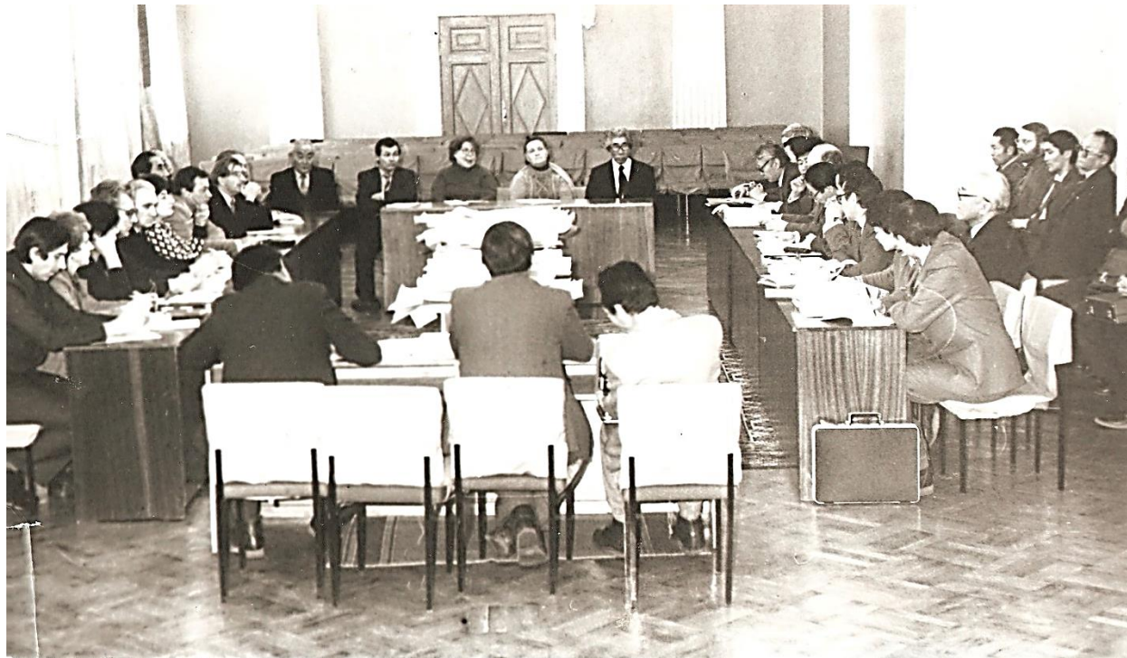
Үндэсний Атлас зохиох ажлын хэсгийн хуралдаан